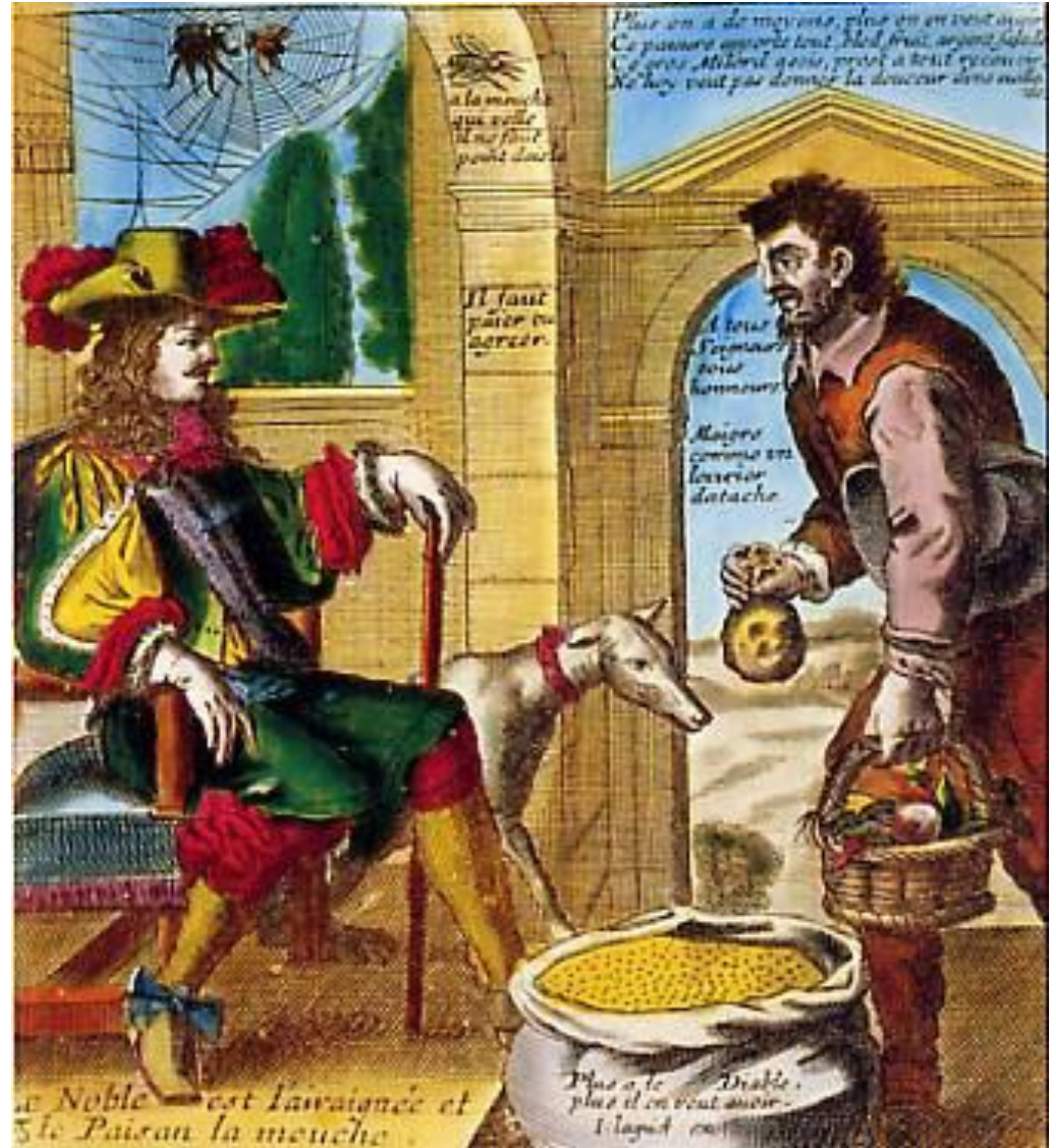
Le noble et le paysan, la mouche et l'araignée, Gravure de Lagnier, 1657, BNF